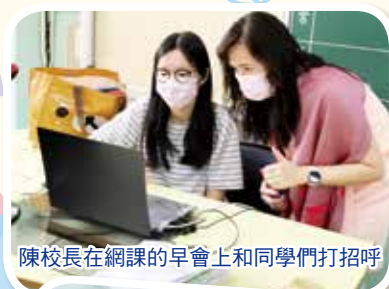
陳校長在網課的早上上和同學們打招呼