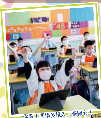
你看！同學多投入，多開心！