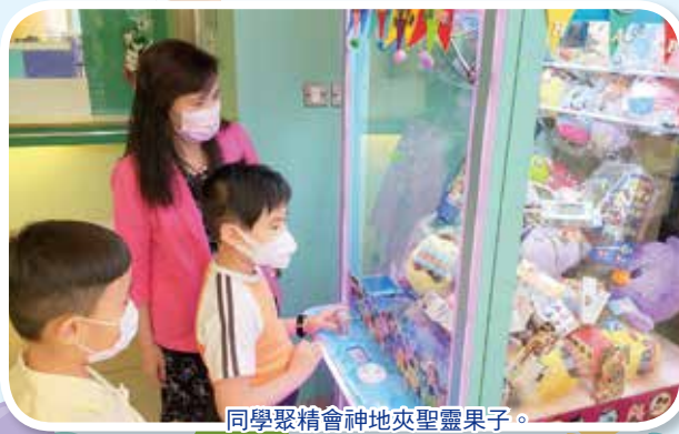
同學聚精會神地夾聖靈果子。