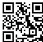
發明品介紹影片的報導