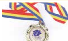
「歐洲盃國際創新發明大賽」金獎