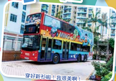
穿好新衫啦！我很美啊！