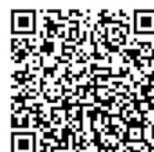
請觀看「讓眼睛閃耀」 圖書分享短片