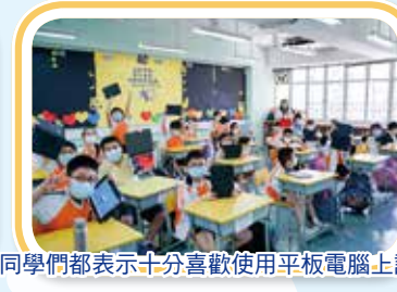
同學們都表示十分喜歡使用平板電腦上課。