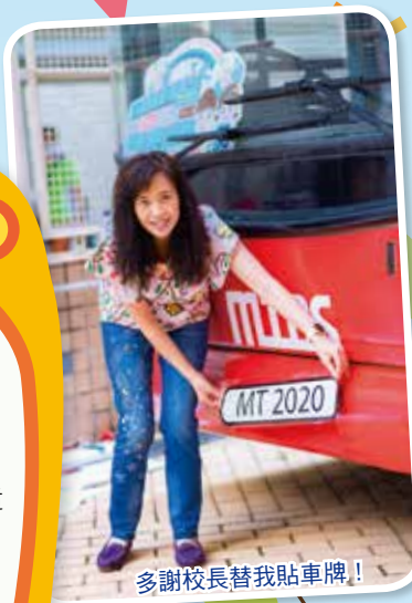
多謝校長替我貼車牌！

我不經不覺已經抵達明道小學一年了！雖然學校已獲得優質教育基金批核我的翻新工程，但教育局正審視全港學校的相關計劃，所以我和學校只能無可奈何地等待，希望能盡快展開改造工程。雖然如此，學校也希望為我添新意，讓同學們對我有耳目一新的感覺，所以經過校長及老師的努力，終於為我設計了一套新「衣服」。實在太美了！我的新「衣服」還加入了我們明道小學不同的元素及特色課程。看看你們能否在我身上找到答案？