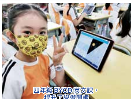
四年級BYOD 英文課，提升了學習興趣