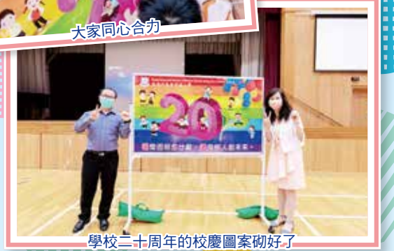
學校二十周年的校慶圖案砌好了