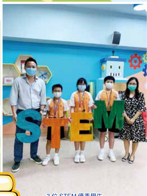
3 位 STEM 優秀學生