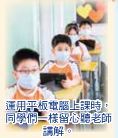
運用平板電腦上課時，同學們一樣留心聽老師講解。

另外，本年度全級一年級的課室安裝了互動觸控大電視，目的是為同學提供更多互動學習的機會，除了老師能運用互動大電視在課堂外，還可讓學生有機會動手畫與動手寫，比傳統投影機畫面更明亮，也能有更多互動學習的機會。