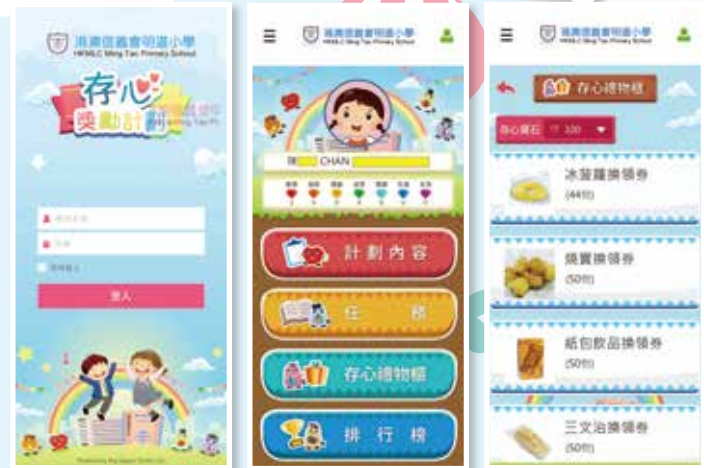
明道獎勵系統——存心APP