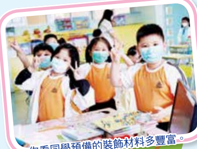
你看同學預備的裝飾材料多豐富。

在我校進行的第一堂班風課，主題是「小分享大發現」。每位學生在壁報上都有自己的小角落，既可以自行張貼各科的佳作，也可以分享自己的喜好，增進老師與同學彼此之間的認識。同學們都十分投入，費盡心思去佈置自己的角落，又張貼自己的得意之作。