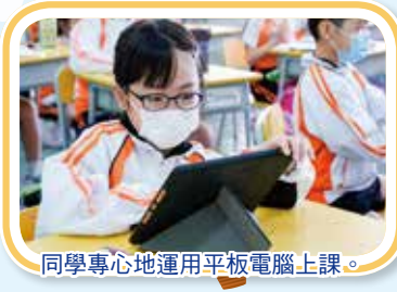
同學專心地運用平板電腦上課。