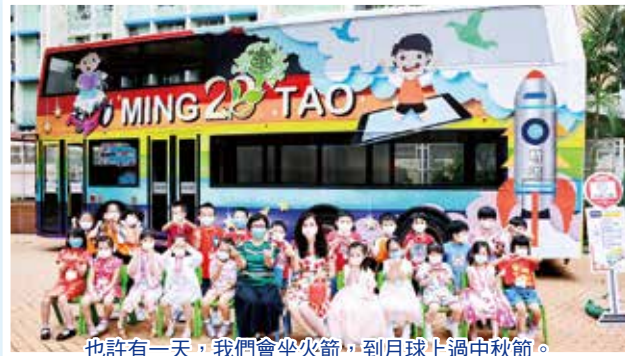
也許有一天，我們會坐火箭，到月球上過中秋節。