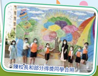
陳校長和部分得獎同學合照