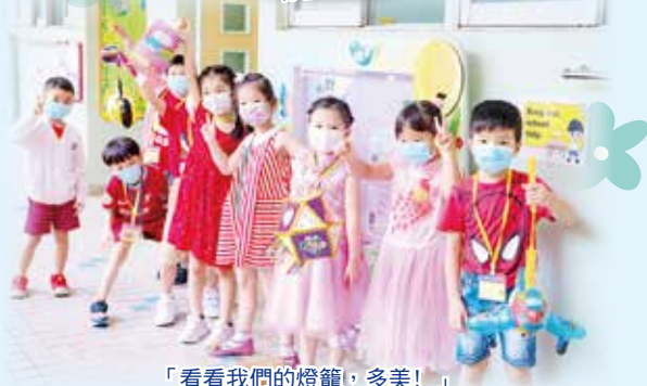
「看看我們的燈籠，多美！」