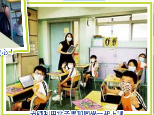
老師利用電子書和同學一起上課