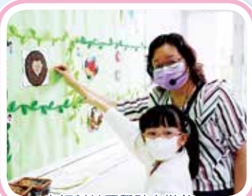
老師幫忙同學貼上裝飾。