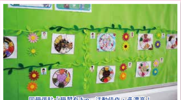
同學張貼「學習有fun」活動佳作，多漂亮！