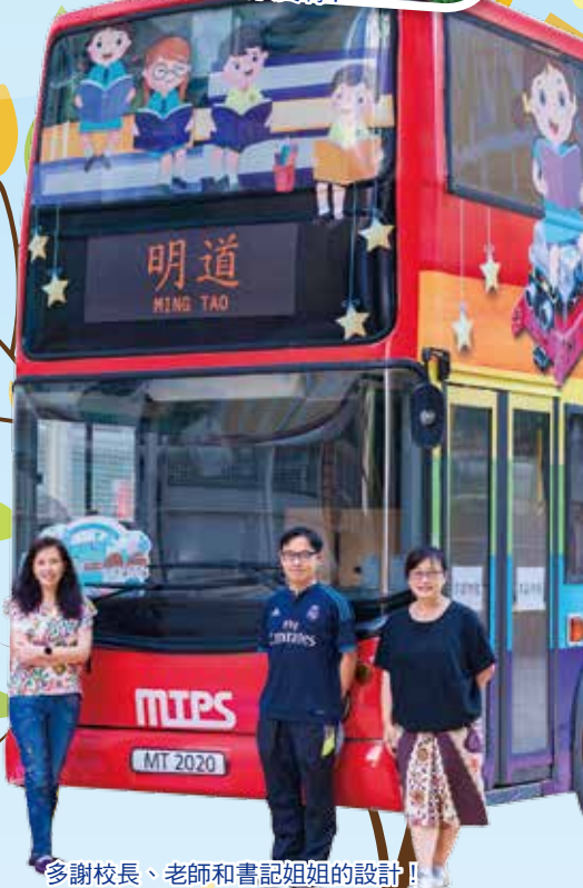
多謝校長、老師和書記姐姐的設計！