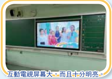
互動電視屏幕大，而且十分明亮。