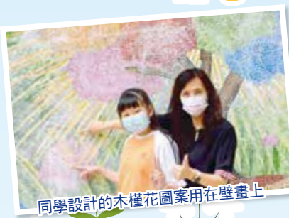
同學設計の木槿花圖案用在壁畫上

我們於 2019-2020 年度舉辦了主題為「感恩珍惜」的馬賽克壁畫親子設計比賽，收集了超過 400 份作品。最後，校長及一眾評委老師選出了 9 份，分別代表 9 種聖靈果子的優秀作品。我們把各同學及家長的意念融入壁畫中，成為具有學校特色的創作。