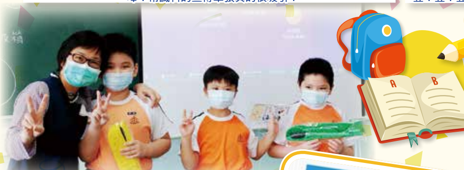
恭喜以上獲獎的同學，太棒啦！