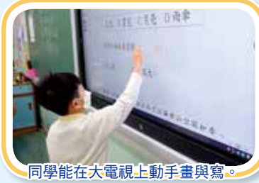
同學能在大電視上動手畫與寫。