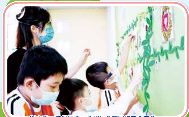
別小看一年級同學，他們的角落同樣美侖美奐。