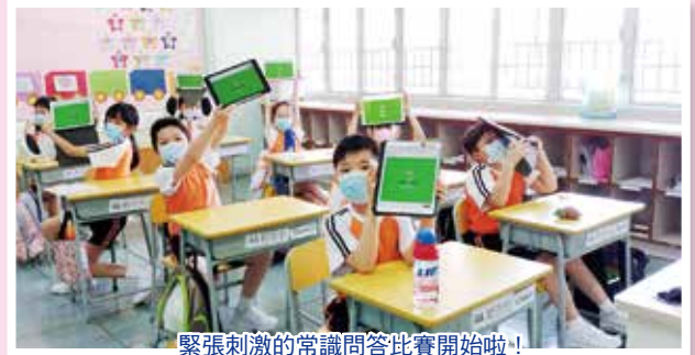
緊張刺激的常識問答比賽開始啦！

活動後，同學們於工作紙上展示自己設計的小發明。透過活動能讓學生對人類的發明更感興趣，成為未來的發明家。