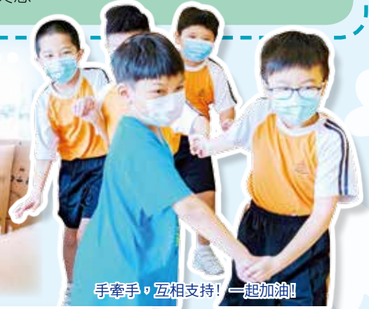
手牽手，互相支持！一起加油！