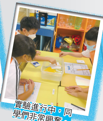
實驗進行中，同學們非常興奮。