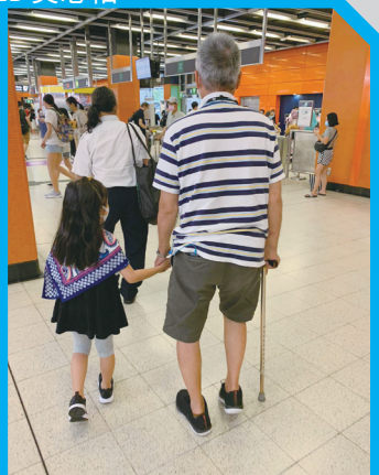
手牽手，展現了兩代之間的愛。