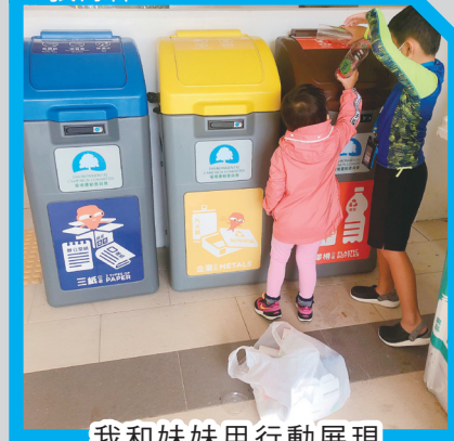
我和妹妹用行動展現對環境及社會的愛。