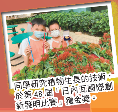
同學研究植物生長的技術，於第48屆「日內瓦國際創新發明比賽」獲金獎。