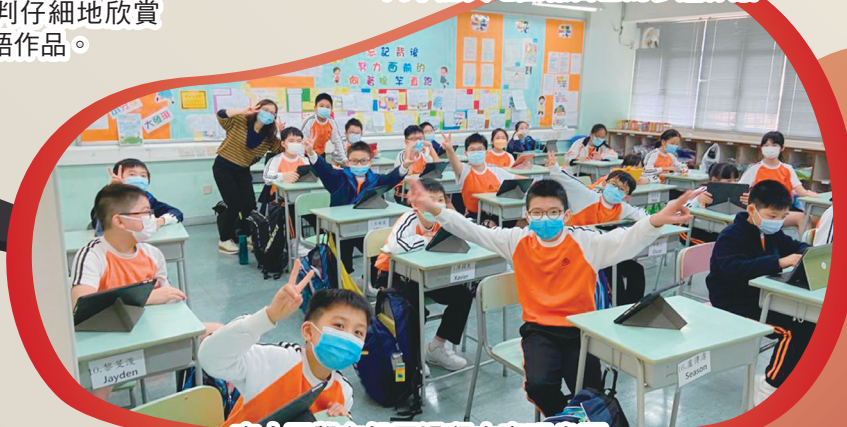
高小同學在投票過程中表現雀躍。