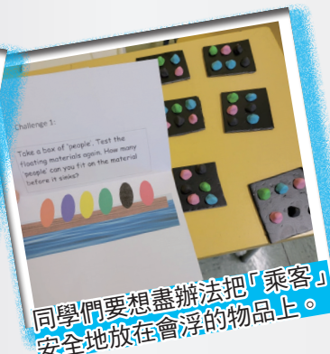
同學們要想盡辦法把「乘客」安全地放在會浮的物品上。