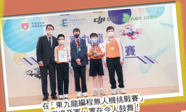
在「東九龍編程無人機挑戰賽」中獲得亞軍，實在令人鼓舞！