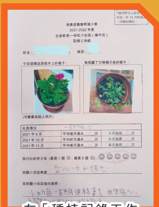
在「種植記錄工作紙」中，同學表達了照顧花苗的感受。