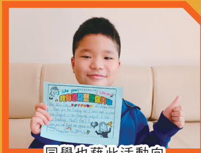
同學也藉此活動向老師表達感謝之情。