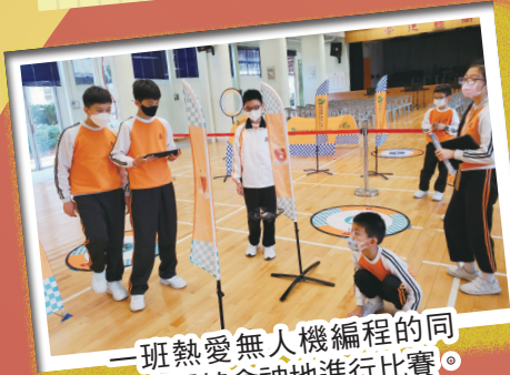
一班熱愛無人機編程的同學正聚精會神地進行比賽。