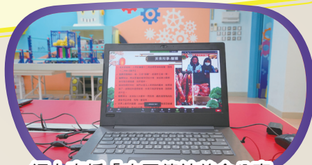
網上直播「中國傳統美食分享」。