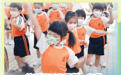
終於可以和同學一起動動身體，做做運動了！