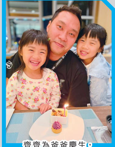
齊齊為爸爸慶生，展現了對父親的愛。