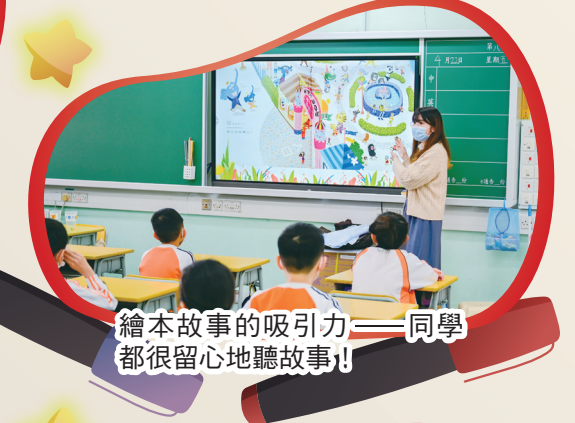
繪本故事的吸引力——同學都很留心聽故事！