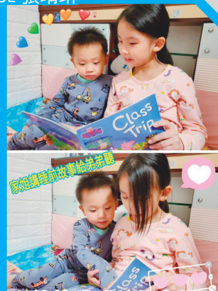
向弟弟講睡前故事，展現了姊姊的愛。