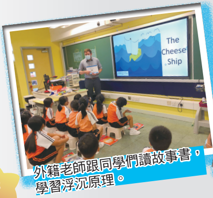
外籍老師跟同學們讀故事書，學習浮沉原理。