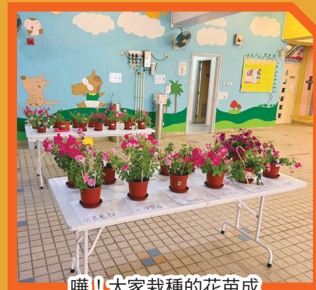
嘩！大家栽種的花苗成長後，變得很漂亮呢！