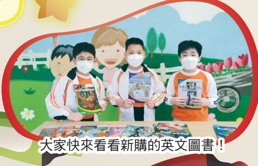
大家快來看看新購的英文圖書！