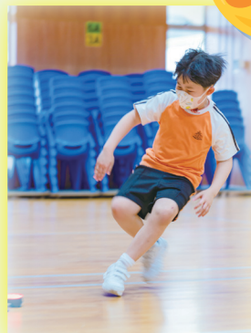
同學速度與反應的比拼！