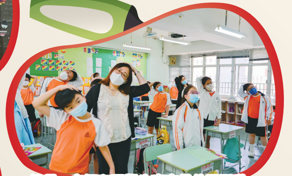
校長、老師和同學也齊來做伸展運動。