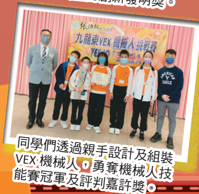
同學們透過親手設計及組裝 VEX 機械人，勇奪機械人技能賽冠軍及評判嘉許獎。