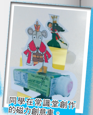
同學在常識堂創作的磁力創意車。