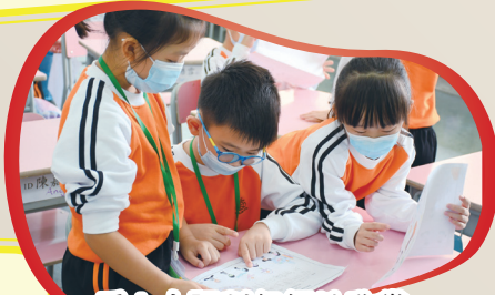
看！小評判仔細地欣賞同學的標語作品。