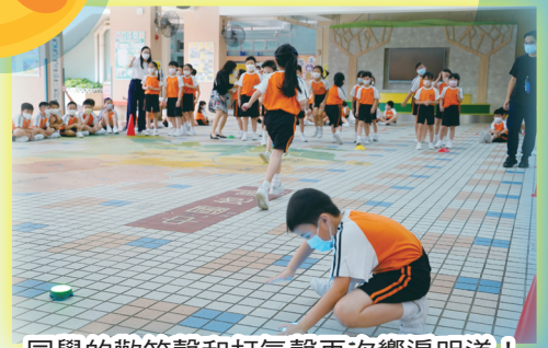
同學的歡笑聲和打氣聲再次響遍明道！