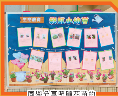
同學分享照顧花苗的過程裡的喜悅和挑戰。