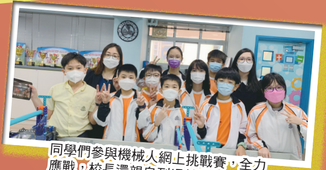
同學們參與機械人網上挑戰賽，全力應戰，校長還親自到場鼓勵同學呢！

本校致力發展學生 STEM 能力，成績有目共睹，除了透過校本數學、電腦、常識和跨科的 STEM 專題研習等不同課程去培育學生外，更透過不同的課外活動及比賽去發掘有潛質的同學，以達至 STEM 教育普及化及資優化的成效。