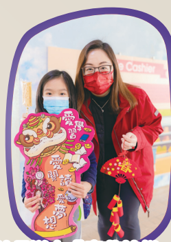
校長送上「麥芽糖餅」，令節日更添溫暖。