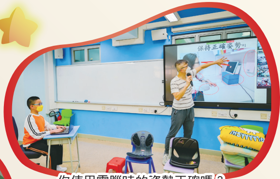
你使用電腦時的姿勢正確嗎？聽聽物理治療師怎麼說吧！