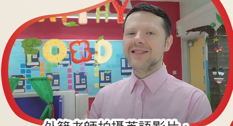
外籍老師拍攝英語影片，讓我們認識健康生活。

為推廣閱讀文化，學校舉行慶祝「世界閱讀日」活動。當天安排了五個精彩的活動，包括故事樂繽紛、真人圖書館、電影欣賞、圖書速遞和 Healthy Living 英語活動，同學們在輕鬆的學習氣氛中能認識到「健康生活」的重要。