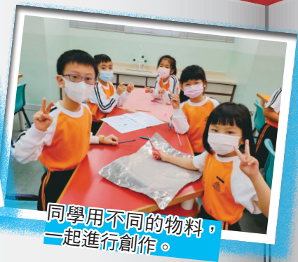
同學用不同的物料，一起進行創作。