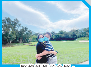
緊抱媽媽的合照，展現了對母親的愛。