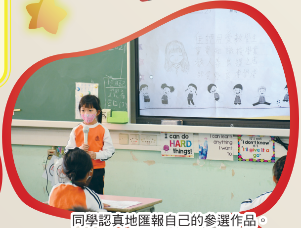
同學認真地匯報自己的參選作品。