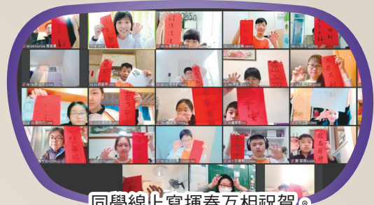
同學線上寫揮春互相祝賀。

活動期間，學校更安排網上互動形式的有獎問答遊戲，獎品豐富。每位同學獲得賀年小吃「麥芽糖餅」，由當天家長回校交收功課時把「麥芽糖餅」轉送給子女，讓學生在疫情中嚐得一點甘甜，將新年氣氛送到家中。