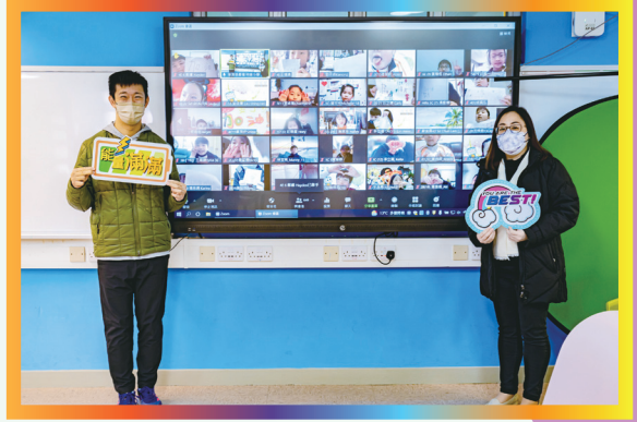
校長跟蘇樺偉與同學們隔著屏幕來個大合照。

明道冬奧會邀請了殘奧 200 米賽跑世界紀錄保持者蘇樺偉擔任嘉賓，透過網上與同學見面分享，學習運動員的堅毅精神，藉此推動正向文化，讓他們在身心健康都得到關顧，勉勵同學逆境自強，面對任何事情都要抱有堅毅與堅持，向著目標邁進。