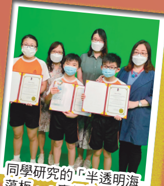
同學研究的「半透明海藻板」，贏得韓國和馬來西亞的創新發明獎。