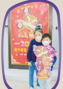
同學在學校特意設計的卡通賀年板前留影，份外醒神。