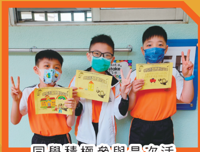
同學積極參與是次活動，希望學校和老師能聽到他們的心聲。