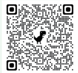
「A capella Junior」精彩片段