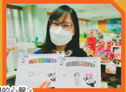
老師收到同學的心聲卡，開心之餘更會用心細閱同學的心聲。